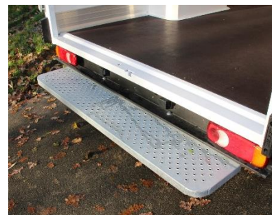
Marche pied arrière grande largeur