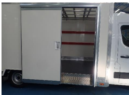
Emmarchement intérieur latéral