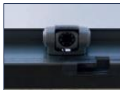
Caméra de recul

*Dimensions à titre informatif, non contractuelles, pouvant évoluer selon la configuration du véhicule. Tolérances ±3%