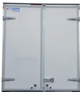
Fermeture par 2 portes arrière battantes version simple