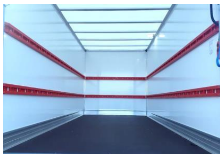
Aménagement Mixte 2 niveaux de capotons composite allégés 2 en 1