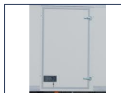
Porte latérale battante

*Dimensions à titre informatif, non contractuelles, pouvant évoluer selon la configuration du véhicule. Tolérances ±3%