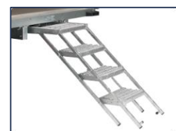
Escabeau 4 marches coulissant