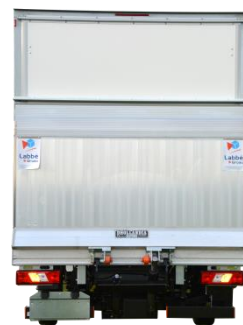
Fermeture par un auvent relevable arrière et hayon élévateur