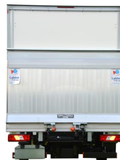
Fermeture par un auvent relevable arrière et hayon élévateur