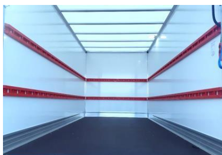
Aménagement Mixte 2 niveaux de capotons composite allégés 2 en 1